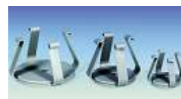
Porte-flacon en option