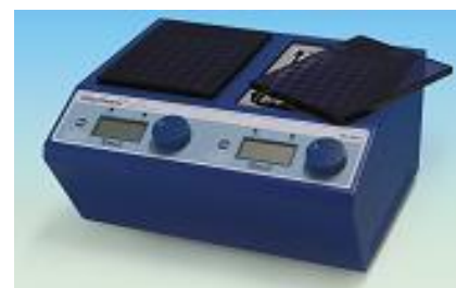
Modèle HB-96D avec 2 blocs de 48 portes-tubes et double contrôleur

Livrés avec : 1 Bloc portes-tubes 48 tubes 1,5ml 2 Blocs portes-tubes 48 tubes 1,5ml