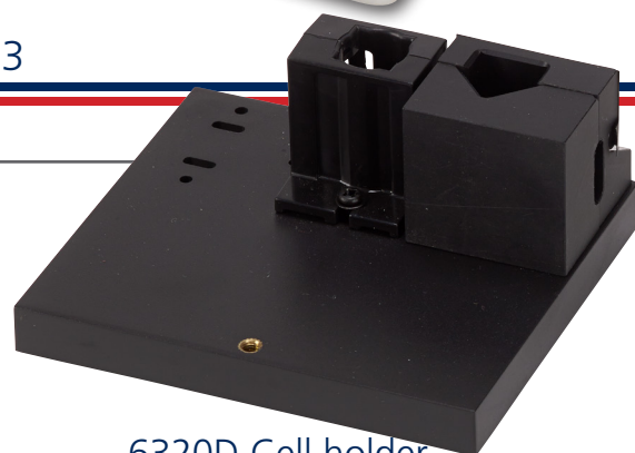
6320D Cell holder